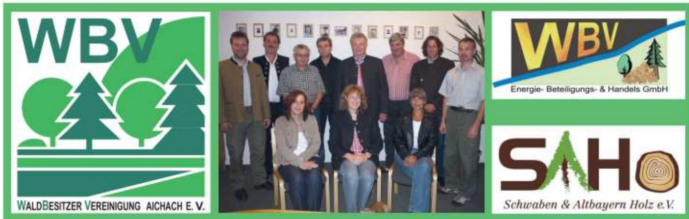
Das Team der WBV Aichach