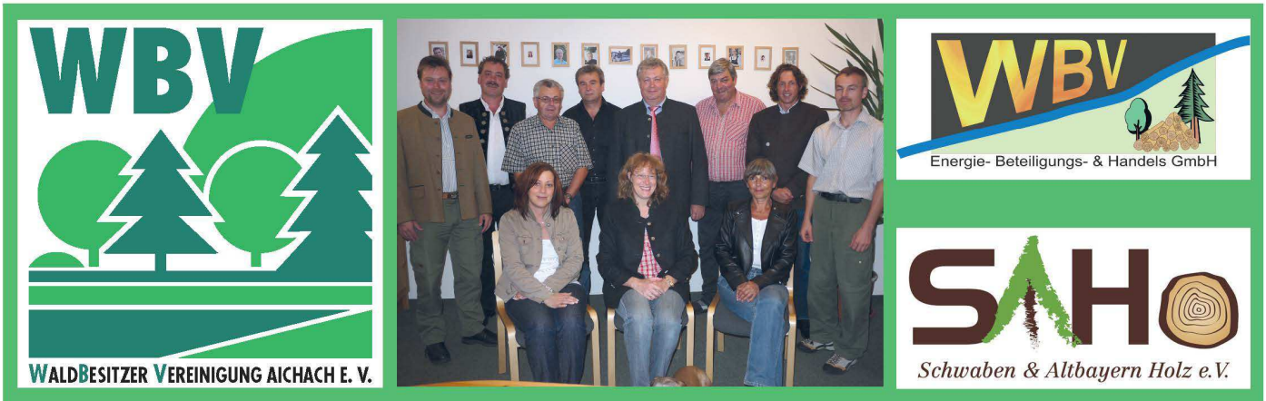
Das Team der WBV Aichach