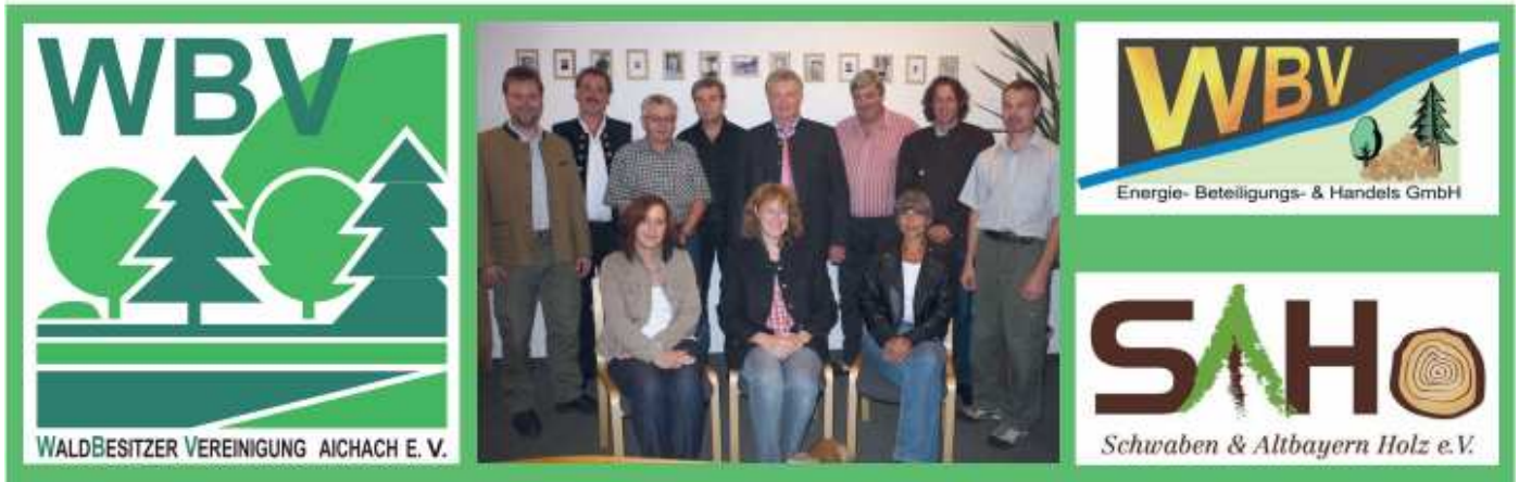
Das Team der WBV Aichach