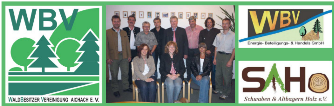
Das Team der WBV Aichach