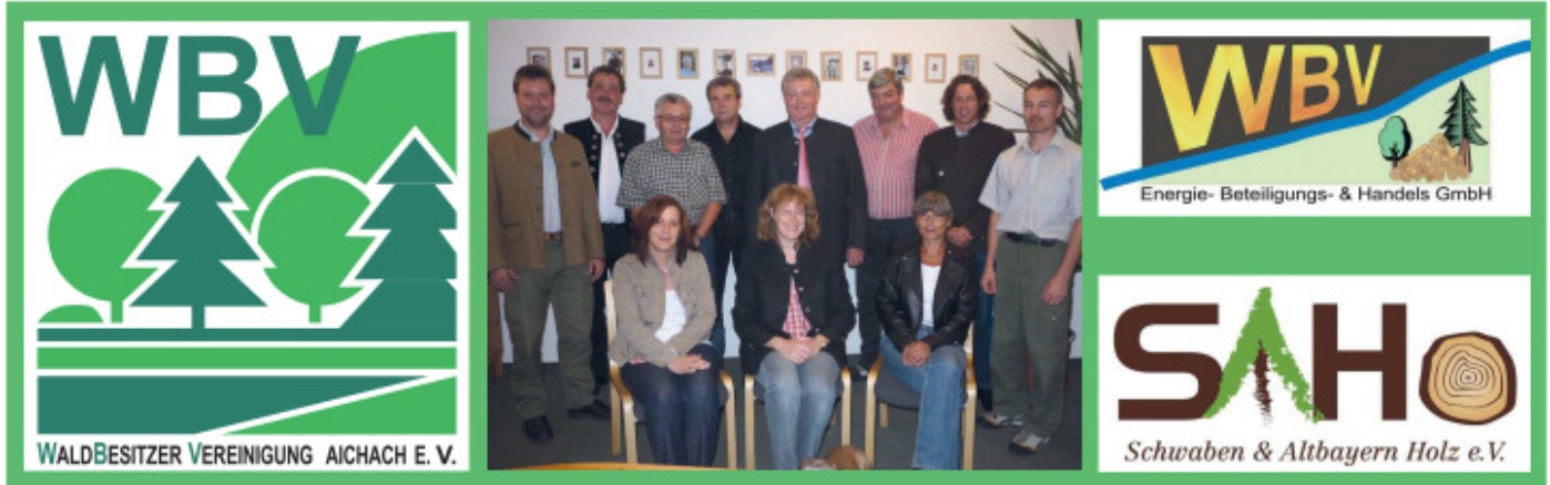
Das Team der WBV Aichach